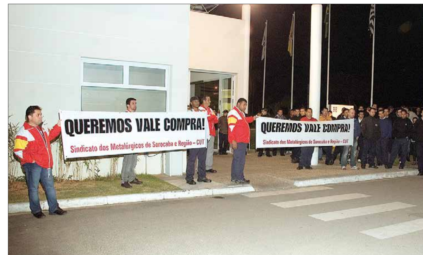
Em julho de 2011, Sindicato dos Metalúrgicos liderou campanha para reivindicar vale compra aos trabalhadores do grupo ZF.

o vale compra isoladamente. Para justificar a concessão do benefício à sua matriz, a alternativa era contemplar a reivindicação em um “pacote”, com Programa de Participação nos Resultados (PPR) e renovação de jornadas, que abrangesse as três fábricas do grupo em Sorocaba.