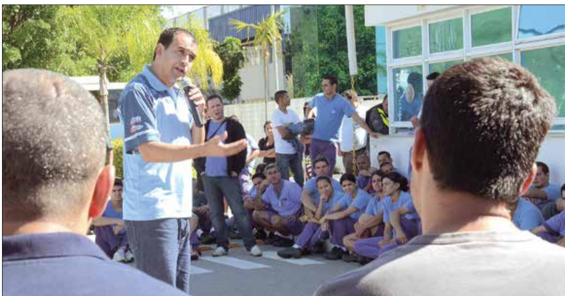
Disposição dos trabalhadores garantiu a conquista do vale compra e outros benefícios

Fato é que o acordo estabelecido pelas partes, Sindicato e empresa, foi colocado à votação de todos os trabalhadores que, durante a assembleia, puderam manifestar sua vontade. Obviamente, o resultado alcançado não agrada a todos, mas, ao olhar para trás e reconhecer a dura queda de braço travada e, com o apoio e união dos trabalhadores, a conquista do vale compra – juntamente com abono e PPR – não deixa de ser uma importante vitória para todos os trabalhadores do grupo ZF em Sorocaba.