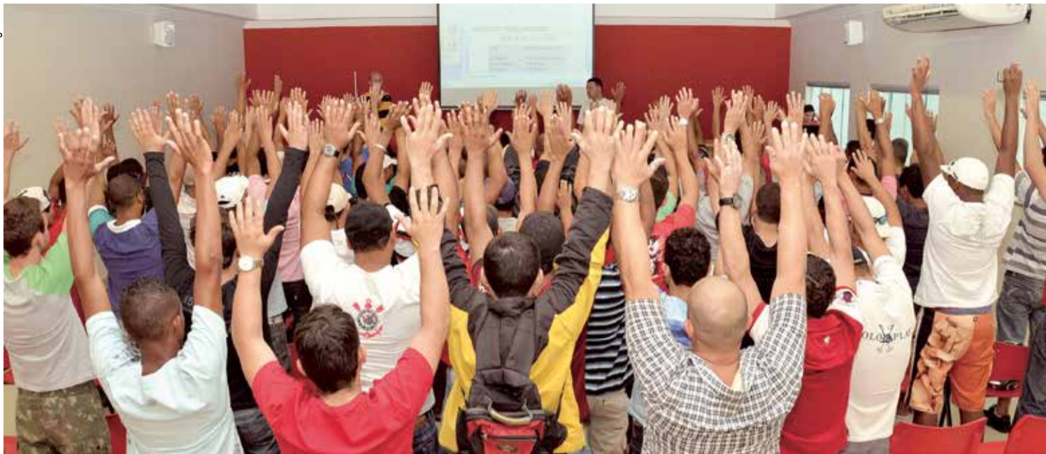
Plenária na manhã de domingo teve participação expressiva de trabalhadores da Kanjiko, que ajudam a tomar decisões sobre a linha de atuação do Sindicato na fábrica

Em plenária na sede do Sindicato em Sorocaba neste domingo, 24, os metalúrgicos da Kanjiko definiram os itens da pauta de reivindicações que será protocolada na fábrica, pelos dirigentes sindicais, nos próximos dias. Os trabalhadores também estabeleceram, no domingo, suas expectativas em relação ao valor da participação nos resultados (PPR) que está sendo negociada com a empresa.