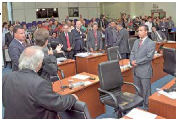
Vereadores que apoiaram o veto tiveram que dar explicações aos munícipes