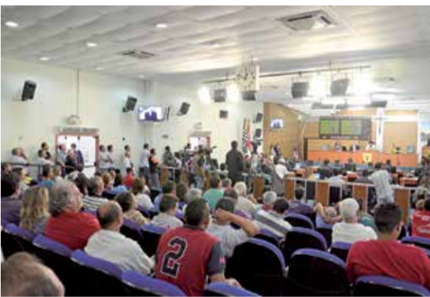
População acompanhou a sessão que discutiu o veto ao Hospital Municipal