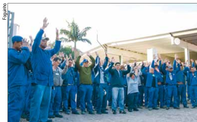
Trabalhadores da Metalur aprovam a pauta da campanha salarial

A paralisação começou dentro da fábrica na tarde desta quarta e continuava até a conclusão desta edição, às 21h da mesma data. O Sindicato está em contato com a Flextronics para que ela retire as ameaças.