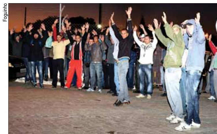
Na Prysman os trabalhadores também estão mobilizados