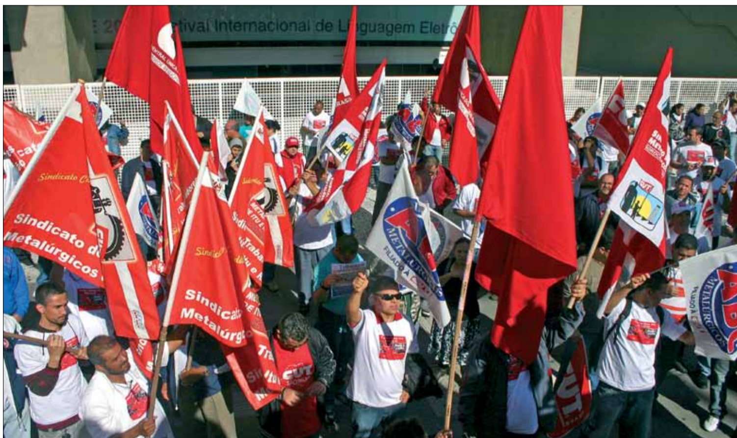
Antes da entrega da pauta, metalúrgicos de todo o estado de São Paulo promoveram um ato na avenida Paulista, em frente ao prédio da Fiesp

Durante a entrega da pauta de reivindicações dos metalúrgicos para este ano, na última sexta-feira, dia 29, os dirigentes sindicais ressaltaram aos empresários que esperam negociações sérias e objetivas, com ganhos reais aos trabalhadores.