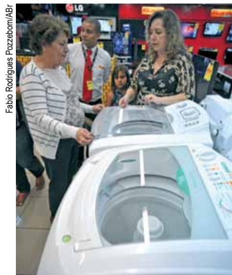
Acordo prevê queda do preço ao consumidor

Entre as contrapartidas estão a manutenção do nível de emprego e abertura de novos postos de trabalho, do nível de nacionalização dos componentes da linha branca e a re-